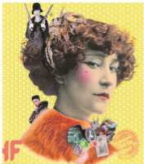
L'association Mieux Vivre de La Sausage a préparé un programme copieux pour les journées du patrimoine.