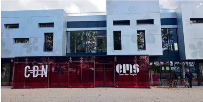
Un espace de 3000 m2 doté d'un parvis