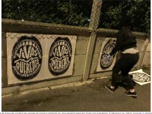
Affiches et gravures portées en paroles en support visuel du mouvement féministe Vivas nos queremos , à découvrir au Tétris, jusqu'au 5 octobre 2019.